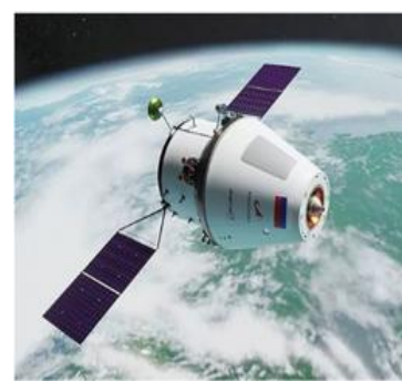
Российский космический корабль «Орел»