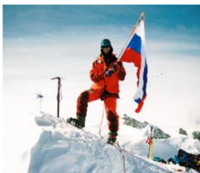
Федор Конюхов покорил Эверест

Перед нами ряд фотографий, предлагаю обсудить, что их объединяет, есть ли у них общая смысловая нагрузка? (см. дополнительные материалы).