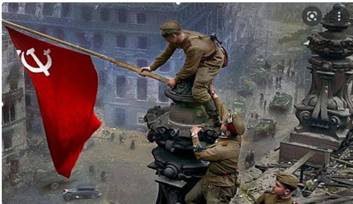
Знамя Победы над Рейхстагом