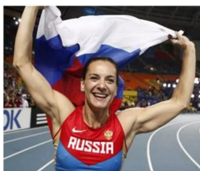
Рекордный прыжок Елены Исинбаевой