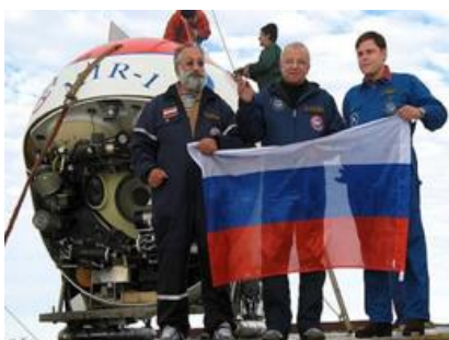
Российский экипаж впервые в мире приземлился на дне Ледовитого океана в точке Северного полюса