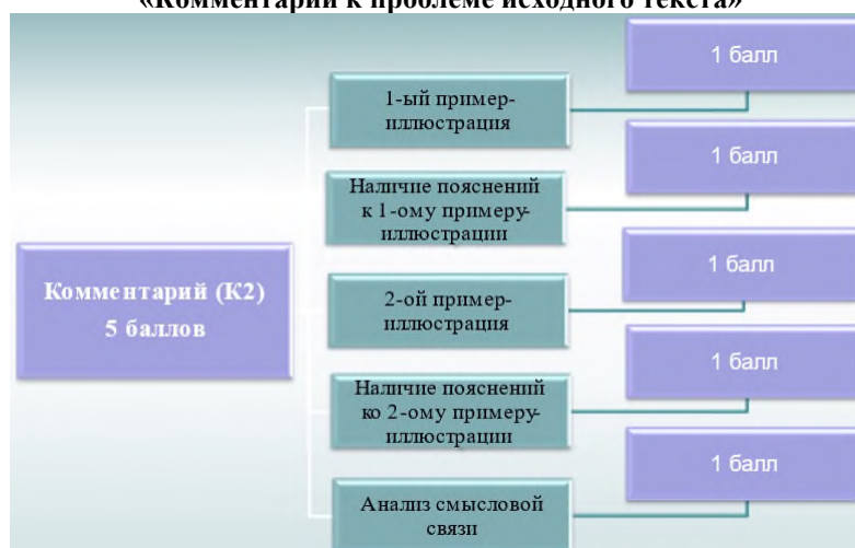
Схема подсчёта баллов по критерию К2 «Комментарий к проблеме исходного текста»